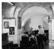
CASA PICCINNI Il Fai propone la petizione per candidare Casa Piccinni a luogo del cuore 2016