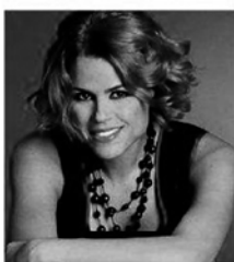
La cantante Tosca