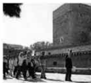
CASTELLO NORMANNO SVEVO In programma la maratona pianistica dalle 10 alle 12,30 e dalle 15,30 alle 19