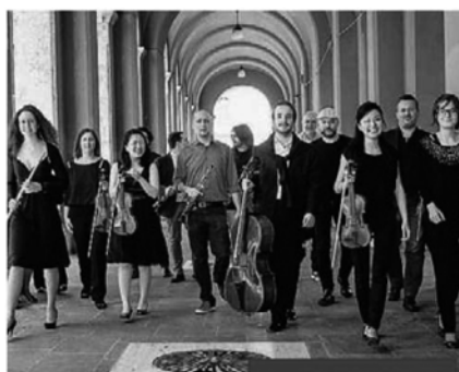
Orchestra di Perugia Stasera a San Pietro