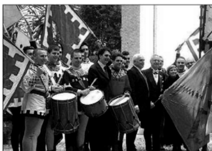
Gli sbandieratori di Gubbio in trasferta con soddisfazioni a Roma

Su invito dell'ambasciatore d'Italia presso la Santa Sede, Daniele Mancini, la città di Gubbio ed il Gruppo Sbandieratori di Gubbio hanno costituito l'evento centrale dell'annuale appuntamento della 'Festa della Musica' svoltosi il 21 giugno, a Roma presso Palazzo Borromeo, sede dell'Ambasciata d'Italia. L'evento, sostenuto fra gli altri dal Ministero dei beni e delle attività culturali e del turismo - si inserisce in un calendario nazionale e mondiale di manifestazioni che si tengono il 21 giugno di ogni anno per celebrare il solstizio d'estate. L'esibizione degli Sbandieratori si è svolta davanti ad un numeroso e selezionato pubblico costituito da numerosi ambasciatori presso il Vaticano e da autorità civili e militari. L'ambasciatore Mancini ha sottolineato la recente apprezzatissima partecipazione del Gruppo Sbandieratori ai festeggiamenti della nascita della Repubblica Italiana presso l'Ambasciata d'Italia a Sarajevo, mentre l'assessore Oderisi Nello Fiorucci, presente in rappresentanza del Comune di Gubbio, ha invitato il pubblico a visitare una città ricca di cultura e tradizioni di cui gli Sbandieratori contribuiscono a trasmettere l'immagine creando emozioni intese negli spettatori. Proprio l'azione costante di rappresentanza dei valori migliori della Città di Gubbio è stata sottolineata dal presidente del Gruppo Sbandieratori, Giuseppe Sebastiani, nel ringraziare del prestigioso invito. ◀