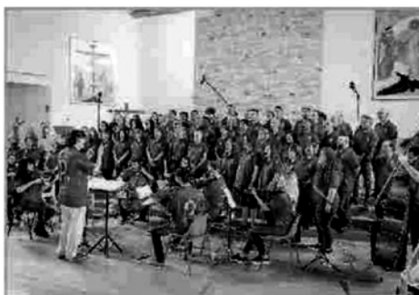
I detenuti del carcere Dozza di Bologna hanno formato il Coro Papageno, nato nel 2011 su iniziativa di Claudio Abbado