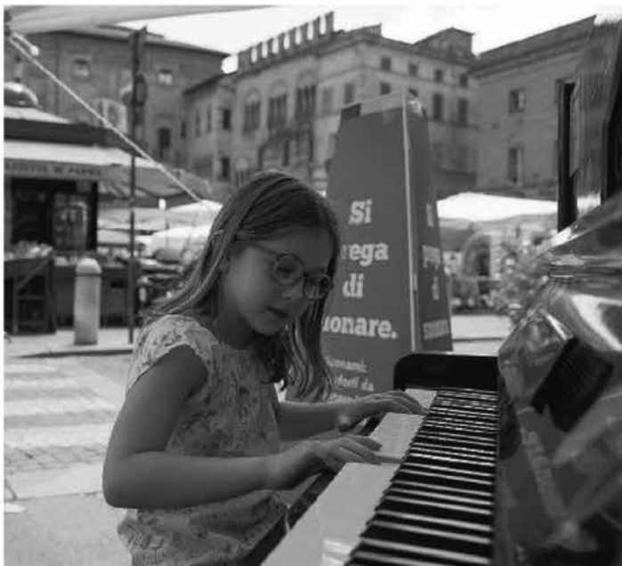
«Suonami!» Piccoli e grandi musicisti o semplici curiosi hanno voluto suonare i pianoforti messi a disposizione dei cittadini. L'iniziativa prosegue ancora oggi e martedì.