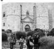
CASTEL DEL MONTE Eventi per la Festa della musica anche a Castel del Monte: dalle 11,30 alle 20