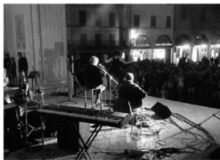
I musicisti hanno protetto gli strumenti suonando sotto il portico