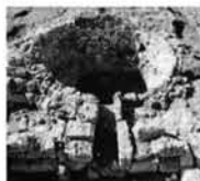
PARCO DI EGNAZIA Nell'area archeologica un laboratorio dedicato ai suoni nell'antichità