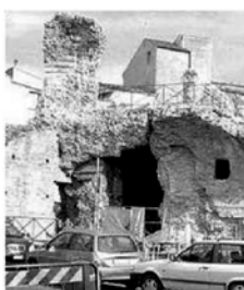
Il teatro romano in via Pianel