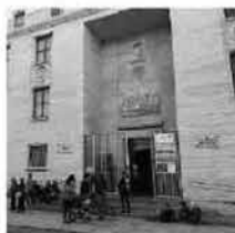
Palazzo Piacentini. La sede del Museo Archeologico nazionale

«Il Museo Archeologico – commenta Malacrino – già prima della riapertura di tutti i livelli dell'esposizione permanente, aveva intrapreso un percorso di divulgazione della conoscenza aperto alla cittadinanza. Il Conservatorio è uno degli enti con i quali le sinergie sono state intraprese sin da subito e stanno continuando in maniera prolifica, come testimoniato anche da questa ulteriore iniziativa che non può che consolidare i rapporti tra le due istituzioni, con l'obiettivo favorire la conoscenza dell'arte in senso lato e contribuire all'ampliamento dell'offerta culturale a Reggio Calabria e alla sua provincia». *