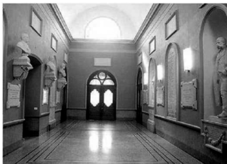
La Biblioteca universitaria di Sassari ospiterà la Giornata della musica

In Sardegna alla Biblioteca universitaria di Sassari nella mattinata concerto itinerante di chitarra all'interno del complesso di piazza Fiume. Alle 16, esibizione del Crazy Heart country-pop trio. Dalle 19.30 alle 21.30 esibizione della banda musicale "Amici della musica" e la mostra "Note tra le pagine: i documenti musicali nella biblioteca universitaria di Sassari", che resterà aperta fino al 21 luglio. JazzOp si sposta, per l'occasione, in piazza Santa Caterina. Al Museo Sanna alle 18 balli e canti della tradizione sarda. A Santa Teresa concerto per pianoforte in Piazza del Sapere alle 21.30. A Cagliari la Soprintendenza offre al jazz, dalle 17, la sede liberty di Palazzo Barrago in via Marche. A Nuoro concerto del Complesso vocale alle 21 nella Chiesa del Sacro Cuore.