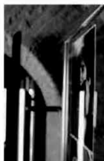
Un percorso suggestivo. Un'immagine della mostra

Sono esposti scatti di scena ma anche immagini inedite e preziosi filmati