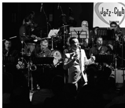
La JW Orchestra sarà in scena martedì sera in Piazza Vecchia