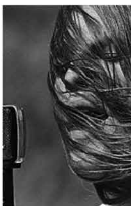
Amarcord Qui sopra, David Gilmour nel '71 e un altro momento del mitico concerto dei Pink Floyd agli Scavi di Pompei A fianco, un'altra delle foto in mostra: l'Anfiteatro