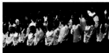
© — Un momento dell'evento al teatro San Carlo

volta al Massimo. Il balletto, su musica di Sergej Prokof'ev (1891-1953), con la coreografia di Mikhail Lavrovskij da Leonid Lavrovskij (1905 - 1967), è stato presentato nell'allestimento del Teatro dell'Opera di Roma. Protagonisti, nei panni dei due giovani e sfortunati amanti, Leonid Sarafanov e Olesja Novikova: il primo solista del Balletto del Teatro Mikhailovskij di San Pietroburgo; mentre la Novikova è la première danseuse del Balletto del Teatro Mariinskij di San Pietroburgo. Accanto a loro, i solisti e il Corpo di Ballo del Teatro di San Carlo, preparati dal Maitre de Ballet Lienz Chang, e accompagnati dall'Orchestra stabile diretta da Aleksej Bogora.