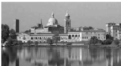
Una suggestiva veduta di Mantova