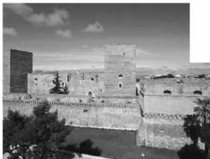
MUSICISTI E COMBATTENTI La Brigata Pinuro durante uno dei suoi trascinati concerti a sinistra il Castello Svevo uno dei luoghi dei concerti