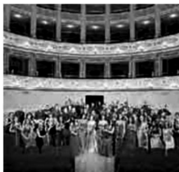
La Filarmonica Gioachino Rossini di Pesaro