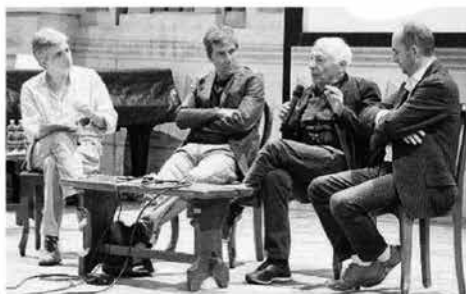
Un momento dell'inaugurazione ieri al teatro Bibiena