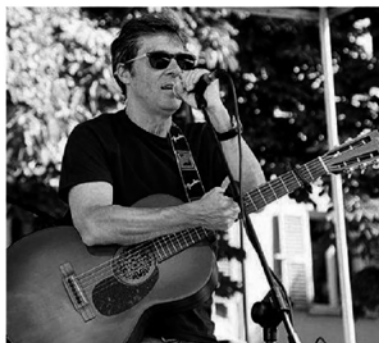
Barbarossa ieri in piazza Sordello

P rima l'afa nel pomeriggio e poi la pioggia in serata: la Festa della Musica ieri ha dovuto fare i conti con i fenomeni atmosferici. Attorno alle 20.30 i concerti si sono interrotti e solo dal palco coperto di piazza Sordello si è continuato a suonare. In piazza Mantegna i musicisti si sono sistemati sotto il vestibolo di Sant'Andrea. Poi qualche live è ripreso dopo le 21.30. La maratona in realtà era iniziata verso le 16. Il primo ad arrivare per il soundcheck sul palco di piazza Sordello, il principale tra i 12 allestiti in tutta la città, infatti, è stato Luca Barbarossa: una prova veloce che però non è sfuggita ai mantovani e ai turisti a passeggio per la città, piacevolmente sorpresi dallo scoprire che per un giorno Mantova era non solo la Capitale della Cultura, ma anche della musica. Pochi passi più in là, finiti i portici, ancora musicisti in centro, e tutti giovanissimi: chi già sul palco, chi in attesa di suonare, alle prese con l'ultima accordatura della chitarra. Sono stati loro i protagonisti di 1000 giovani per la Festa della Musica , l'evento di anteprima della manifestazione che si svolge in tutta Europa il 21 giu-