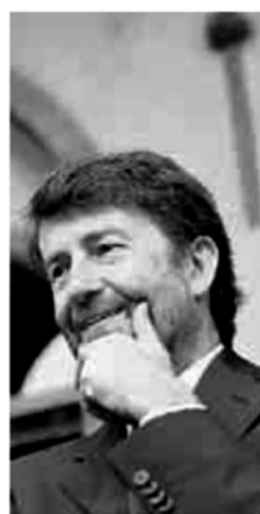
Il ministro Dario Franceschini

Dal 1985, Anno Europeo della Musica, la Festa della Musica si svolge in Europa e nel mondo. Dal 1995, Barcellona, Berlino, Bruxelles, Budapest, Napoli, Parigi, Praga, Roma e Senigallia sono le città fondatrici dell'Associazione Europea Festa della musica. Dal 2002, in Italia si forma una rete di più di 120 città. Da quest'anno il Mibact ha deciso di dare un forte segnale per la promozione di una delle feste più affascinanti che la cultura possa offrire; un progetto capace di trasmettere valori di partecipazione, integrazione, armonia e universalità che solo la musica riesce a dare. Un grande evento che porta ogni tipo di musica in ogni tipo di luogo. Un grande evento che coinvolge enti locali, accademie, conservatori, scuole di musica, università, solisti, cori, orchestre, gruppi e bande musicali: in una parola tutti coloro che fanno musica.