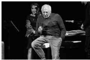
Tra i tanti ospiti ci sarà anche Mogol

gnerà a Cortez, giovane cantautore emergente, vincitore del Superstage 2015 - uno dei principali contest nazionali per giovanissimi, organizzato dal MEI, che tornerà per la sua nuova prima edizione del nuovo corso a Faenza dal 23 al 25 settembre, dedicato a Lucio Battisti, insieme alla rivista musicale ExiWell - una borsa di studio del Cet, il Centro Europeo Tuscolano di Mogol, mentre i giornalisti di La Repubblica Ernesto Assante e Gino Castaldo incontreranno i giovani musicisti durante una grande e unica lezione sulla storia del Rock.