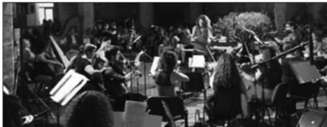
L'ensemble TaranTango si esibirà questa mattina al museo archeologico