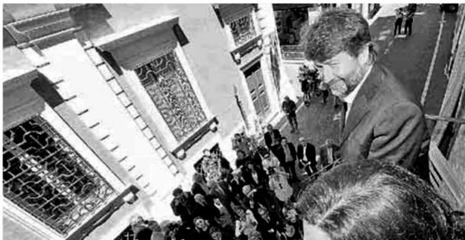
Il ministro Dario Franceschini dal balconcino di Casa Rossini saluta i curiosi che lo hanno riconosciuto