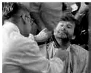
Barba e niente capelli per Dario Franceschini