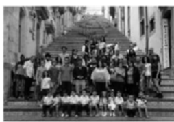
I PARTECIPANTI ALLA FESTA DELLA MUSICA

Il Comune di Caltagirone ha aderito alla Festa della musica che, promossa dal ministero dei Beni e delle Attività culturali e dall'Aipfm, si è svolta ieri, in diverse "location" della parte antica della cittadina: prima, alle 16,30, sulla Scala di Santa Maria del Monte, c'è stato il raduno delle band e dei musicisti; poi, da piazza Municipio, si è assistito alla