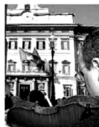
Si suonerà anche nelle piazze

«Una delle strategie più bieche che sta dietro agli attacchi del terrorismo internazionale è l'idea di far cambiare la vita alle persone, non farle andare più nei luoghi in cui ci si diverte», ha detto infine con forza Franceschini , e la Festa della Musica è un modo per «reagire a questa sfida, non cambiare i modi di vita, non rinunciare ai momenti e ai luoghi in cui la vita si vive». 4