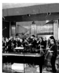
Musica al "Cimarosa"